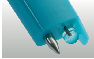
testo 206-pH1: sıvılar için pH1 prob başlığı