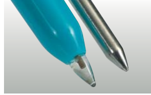
testo 206-pH2: yarı-katı gıdalar için pH2 prob başlığı