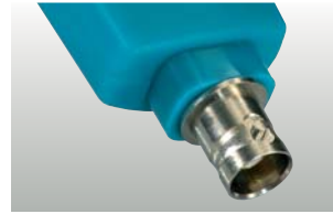
testo 206-pH3: BNC arayüzü ile pH3 prob başlığı