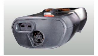
Harici problemler için 2 bağlantı