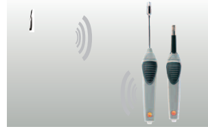
Açık alanda 20 metre mesafeye kadar, kablosuz sıcaklık ve nem ölçümü

Kablolu problemlere ek olarak, 20 m ye kadar kablosuz ölçüm yapmak mümkündür (engelsiz). Kablonun zarar görmesi veya kullanımda meydana gelen hasarlar ortadan kalkar. Maksimum 3 adet kablosuz prob kaydedilebilir ve testo 435 ile görüntülenebilir. Kablosuz problemler, sıcaklık ve cihaz tipine bağlı olarak nem ölçüm parametreleri içindir. Opsiyonel olarak; cihaza kolayca takılabilen radyo modülü, istenilen zamanda entegre edilebilir.