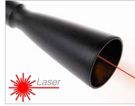
Uzun mesafeli modül