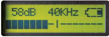
Ölçek NIST'e göre izlenebilir kalibre edilmiş desibel cinsindedir.

Ultraprobe® 9000 çok yönlü ve kullanımı kolay bir dijital ultrasonik denetim, bilgi, depolama ve geri kazanım sistemidir (çoğu operatör 15 dakika içinde öğrenebilir!). Bu Ultraprobe® denetimler arasında çabucak hareket etmenize yardımcı olacaktır. İster sorun giderme ister önceden planlanmış bir saha için kullanılsın, veriler gösterge paneli üzerinde kolayca görülebilir ve bir düğmeye dokunularak depolanabilir.