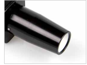
Yakın odaklı modül