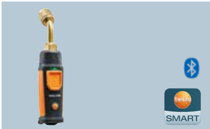
testo 549i Kablosuz yüksek basınç probu