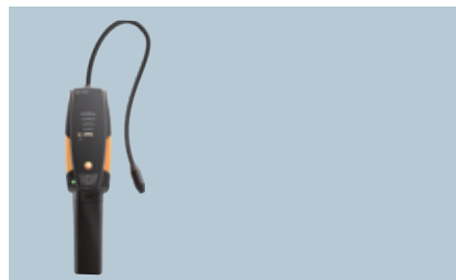
testo 316-3 Soğutucu akışkanlar için kaçak dedektörü