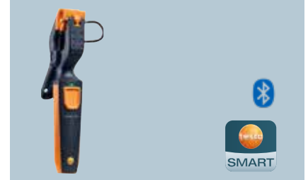
testo 115i Kablosuz sıcaklık probu