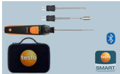
testo 915i Kablosuz sıcaklık seti testo çanta ve piller ile