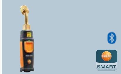
testo 552i Kablosuz vakum probu