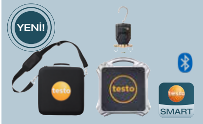
testo 560i Akıllı valfli sette dijital gaz terazisi + çanta