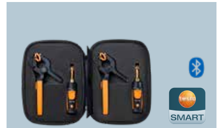
testo Akıllı Problar Soğutma seti

2x testo 115i / 2x testo 549i 1 x testo çanta Sipariş no. 0563 0002 10