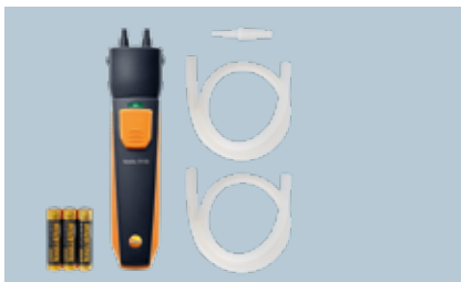
testo 510i Kablosuz fark basınç ölçüm cihazı

2x testo 115i / 2x testo 549i 1 x testo çanta Sipariş no. 0563 0002 10